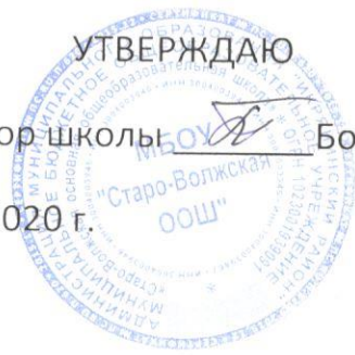
График уборки помещений для приготовления и приема пищи